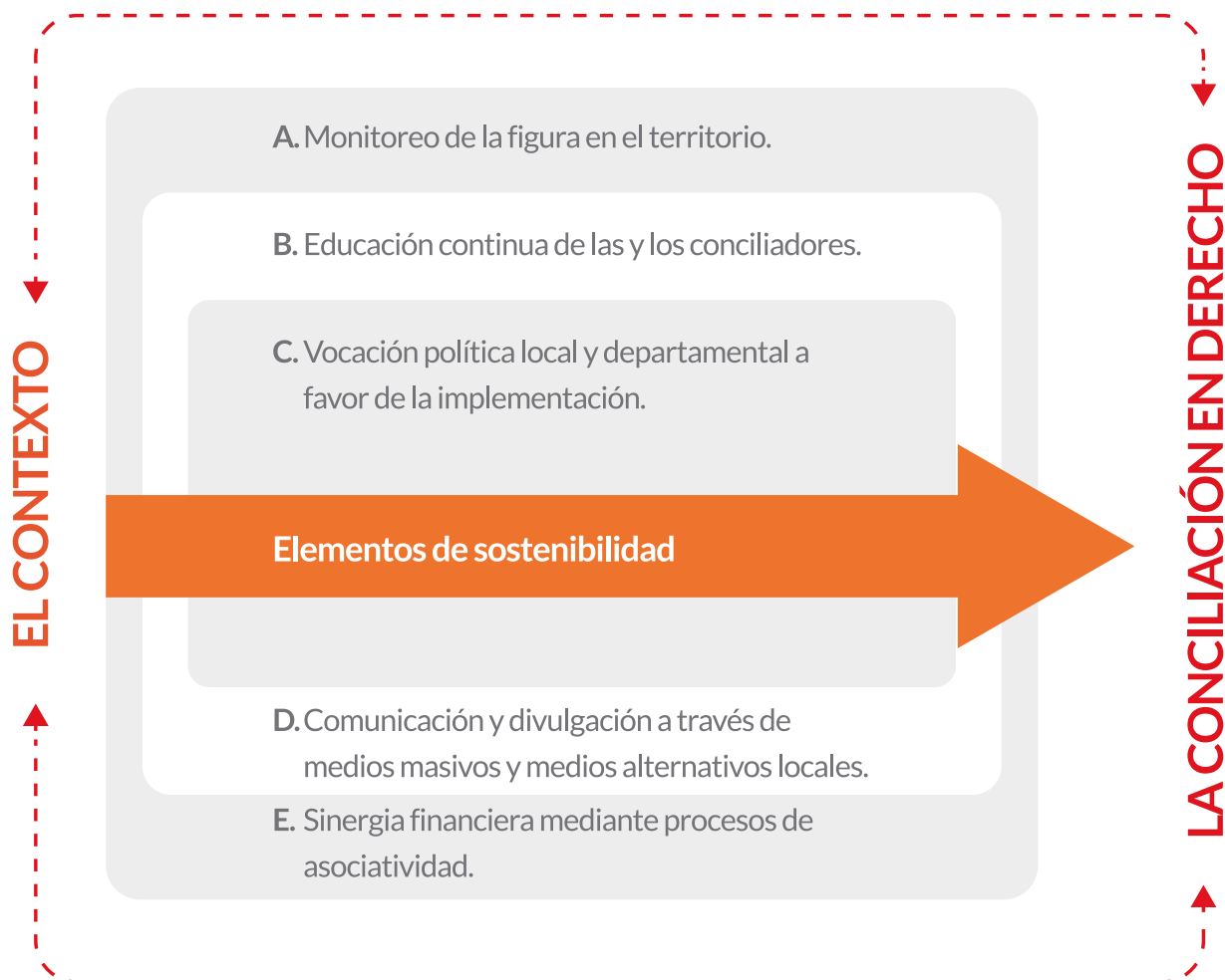
—Gráfica 3. Guía para la implementación de la conciliación en derecho.

En esta etapa es recomendable, realizar las siguientes actividades: