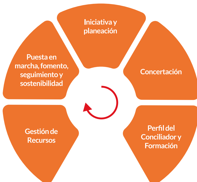
—Gráfica 1. Modelos de mediación - Elaboración propia

Nuestra ruta de implementación consta de los siguientes pasos, cuyo orden de aplicación podrá variar dependiendo del estado de la prestación del servicio de Conciliación en su municipio: