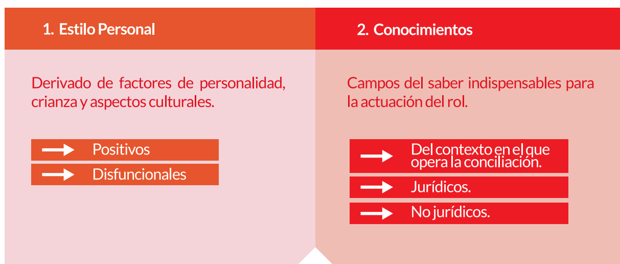
—Gráfica 2. Atributos deseables del Conciliador en Derecho

ATRIBUTOS DESEABLES DE LOS SERVIDORES PARA EL EJERCICIO DE LA CONCILIACIÓN